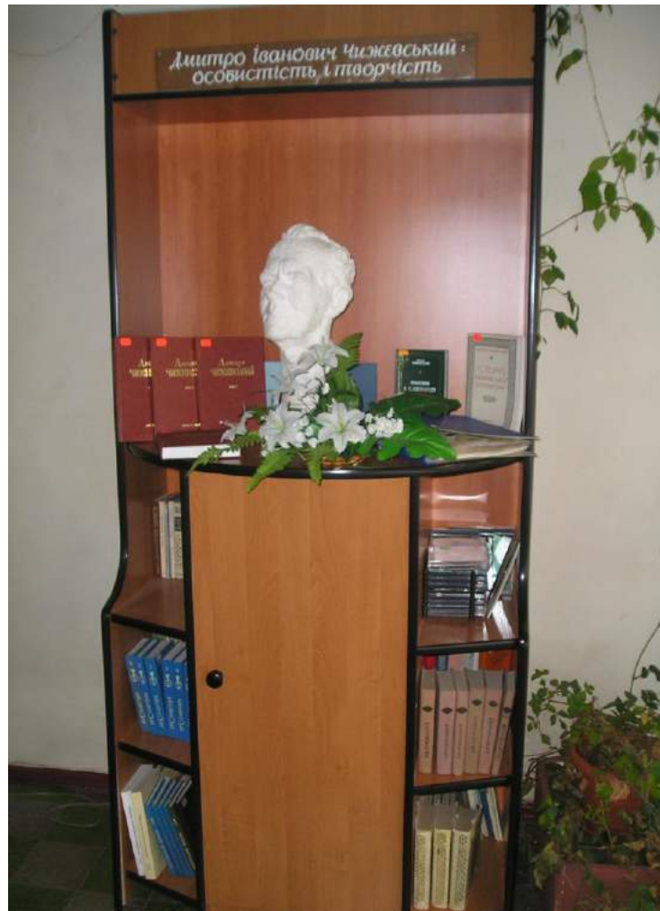
Куточок вченого у відділі краєзнавства. Автор скульптурного погруддя Дмитра Чижевського Міртала Бентов (Бельмонт, Массачузетс).