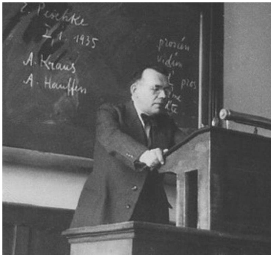
Дмитро Чижевський читає лекції в Галле, 1935 р.