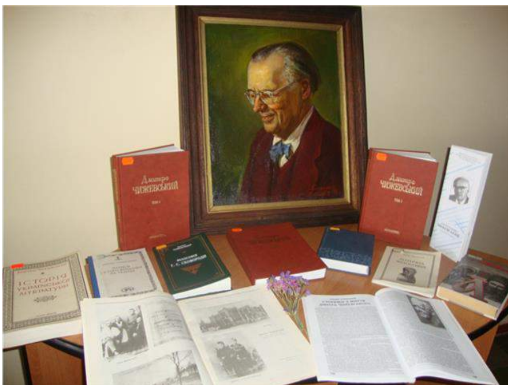
Портрет Дмитра Чижевського. Художники Валерій Давидов та Юрій Гончаренко, 1999 р.