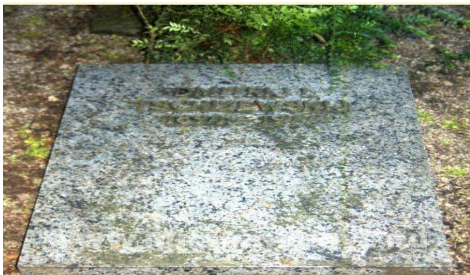
Германія, Гейдельберг, Нагорне кладовище