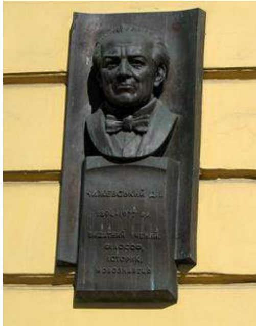
Меморіальна дошка Дмитру Чижевському на фасаді Інституту філології Київського національного університету імені Тараса Шевченка