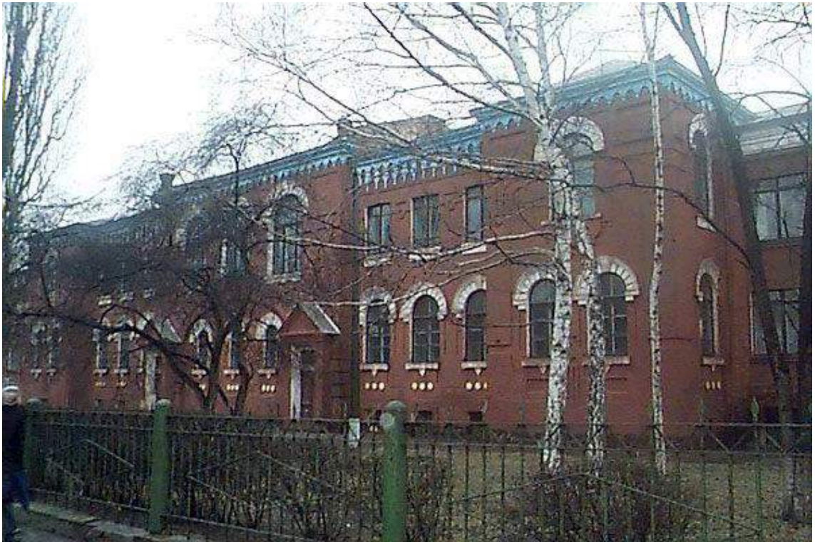
Олександрійська гімназія, де навчався Д.І.Чижевський.