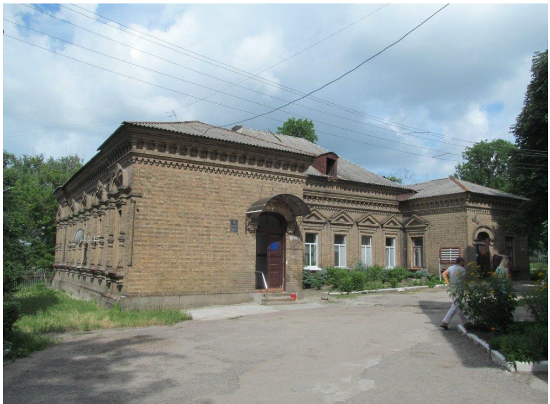
У дворі пологового будинку