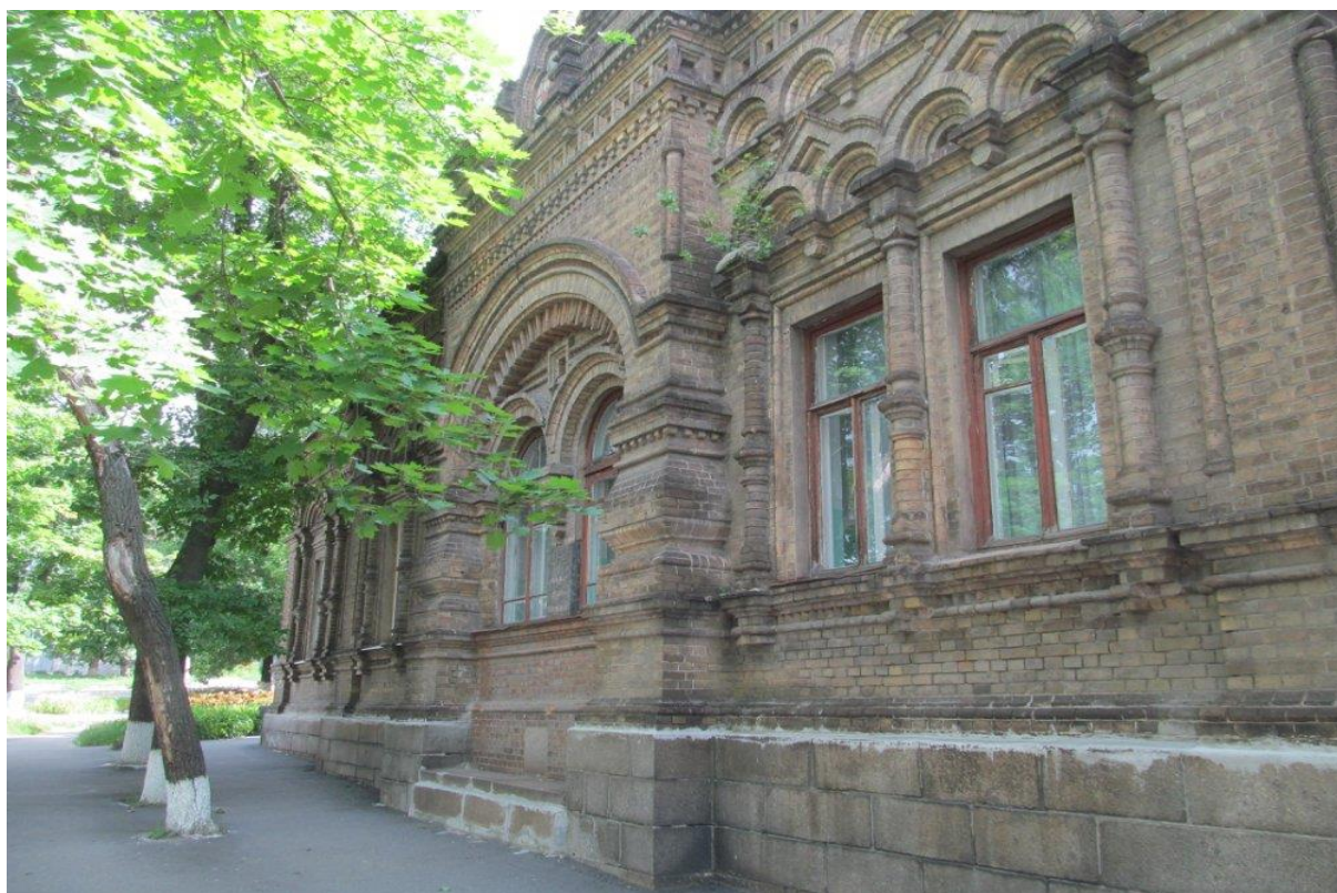
Пологовий будинок № 2 ім. Святої Анни (XXI ст.)