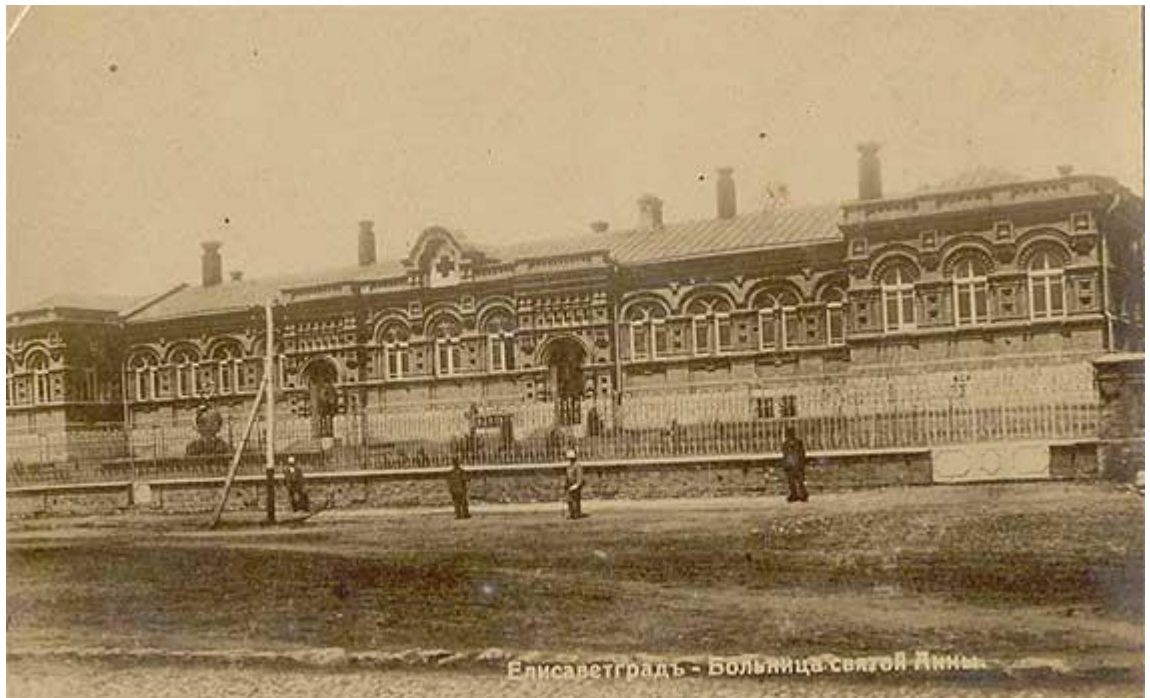
Лікарня Святої Анни (1904 рік)