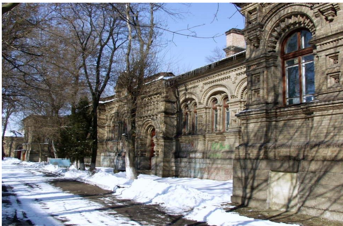
Пологовий будинок № 2 ім. Святої Анни (XXI ст.)