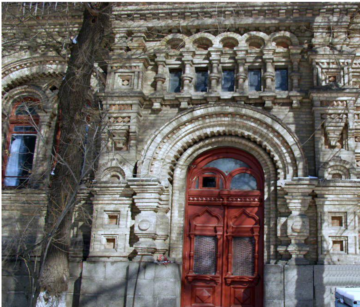
Пологовий будинок № 2 ім. Святої Анни (XXI ст.)