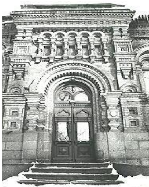
Лікарня Святої Анни (XX ст.)