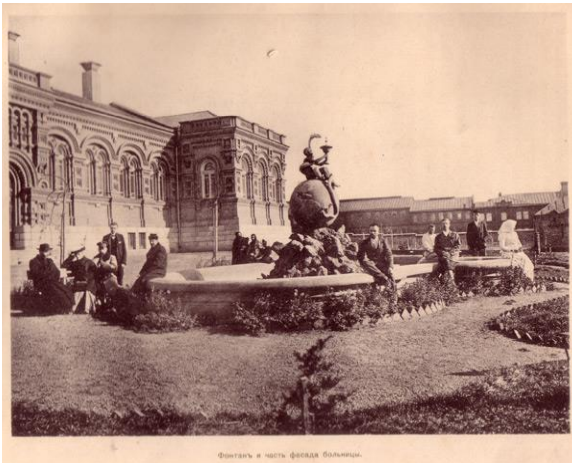
Фонтанъ и часть фасада больницы.