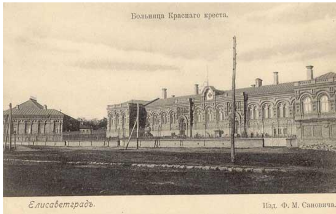
Лікарня Святої Анни (1904 рік)