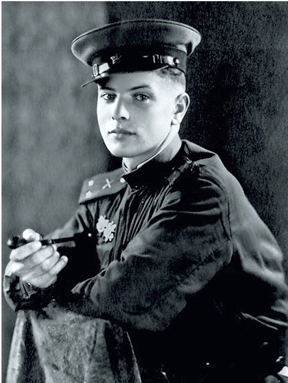
Петро Тодоровський в юності (період Другої світової війни)