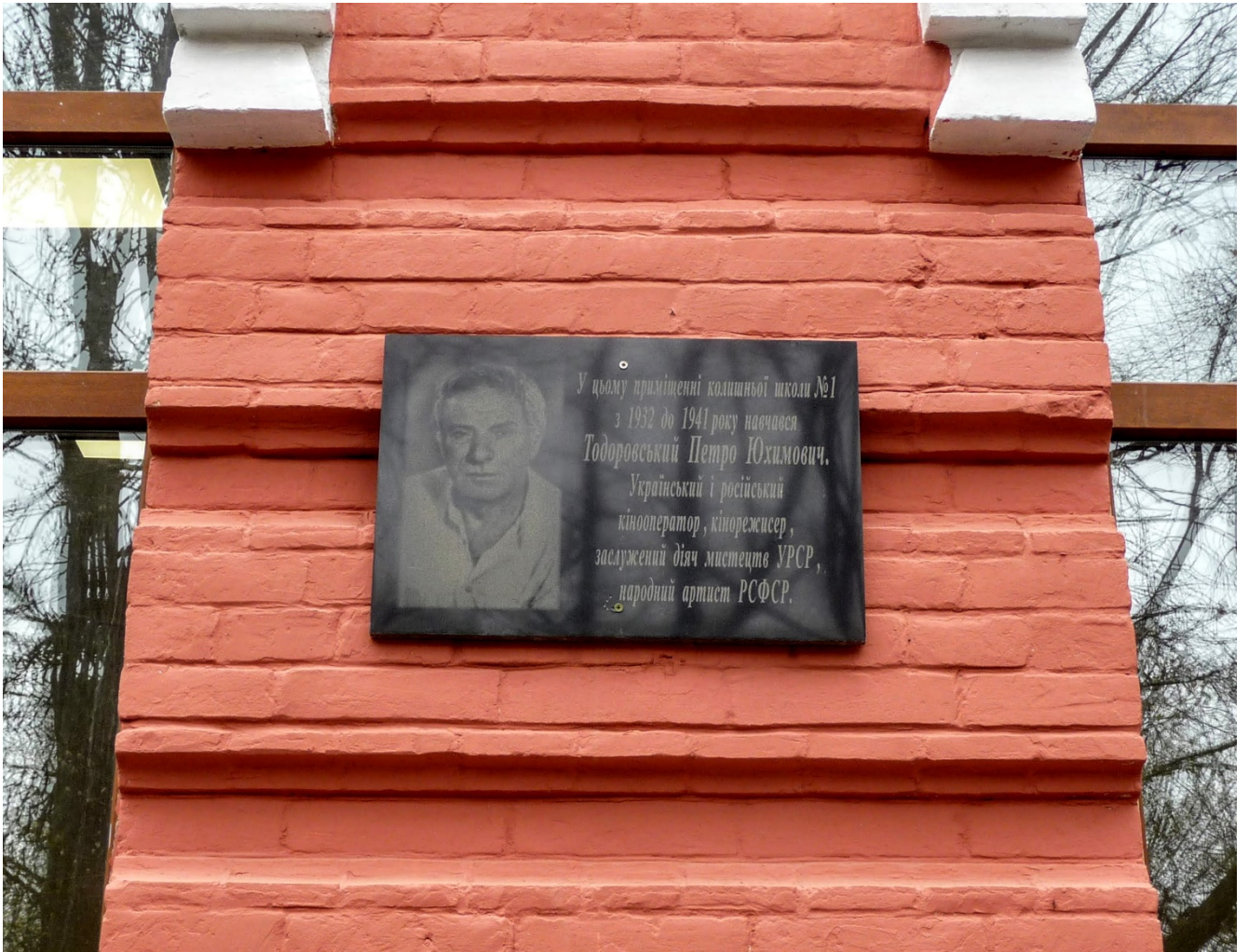
Меморіальна дошка П. Ю. Тодоровському на фасаді Бобринецького НВО «НВК «Гімназія-загальноосвітня школа I-III ступенів», філія № 2 (м. Бобринець)