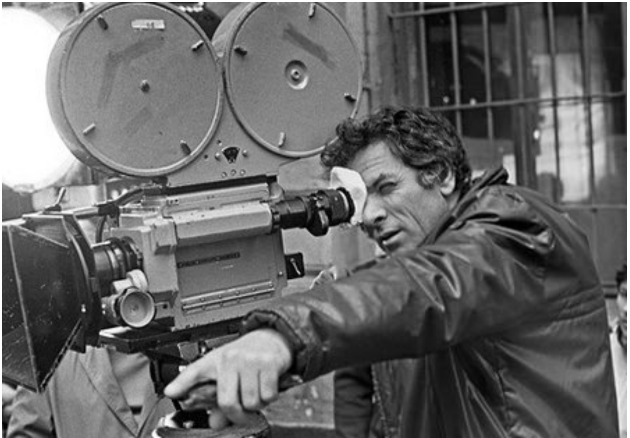
На зйомках фільму «Остання жертва» (кіностудія «Мосфільм», 1975 р.)