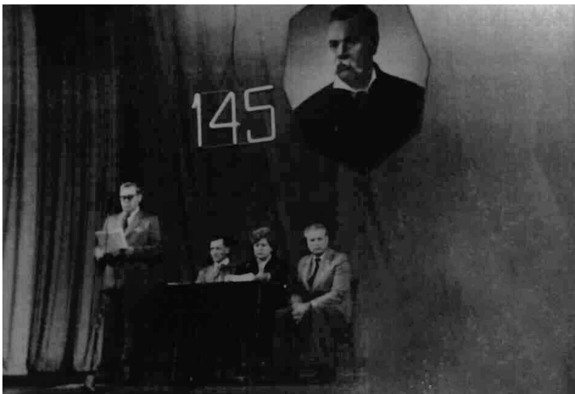
1985-й рік. Палац культури імені Жовтня. Відзначення 145-ї річниці з дня народження Марка Кропивницького.