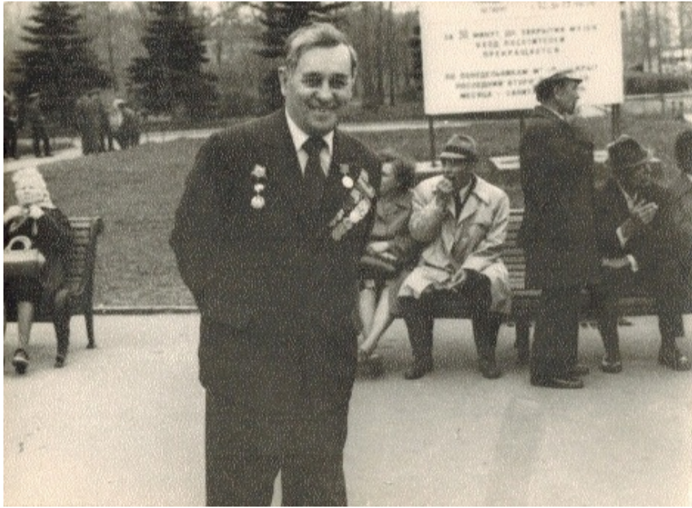
1980-й рік, 9 травня. Москва.