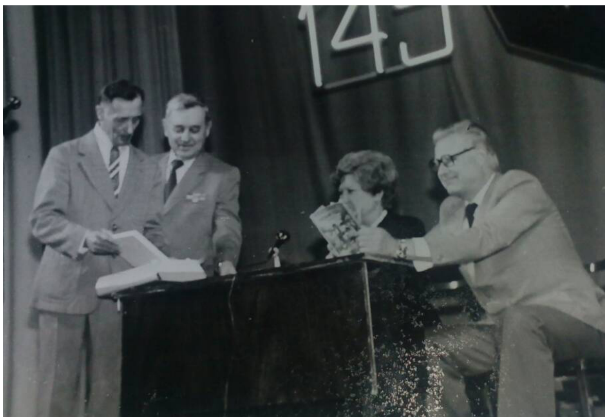
1985-й рік. Палац культури імені Жовтня. Відзначення 145-ї річниці з дня народження Марка Кропивницького.