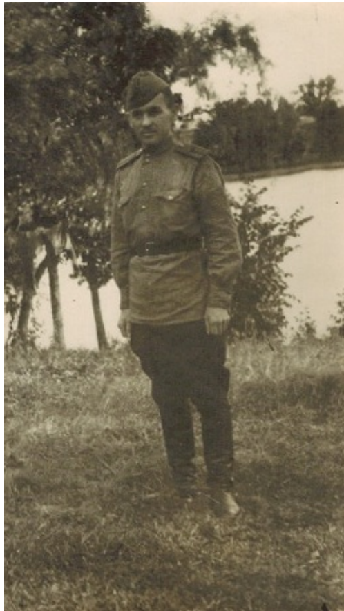
1944-й рік, осінь.