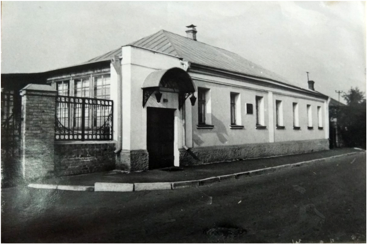
Меморіальний музей М.Л. Кропивницького у роки роботи Віктора Яроша.