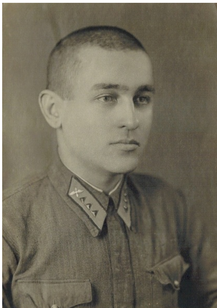
1939-й рік, грудень. Москва. Перед відправкою на радянсько-фінську війну.