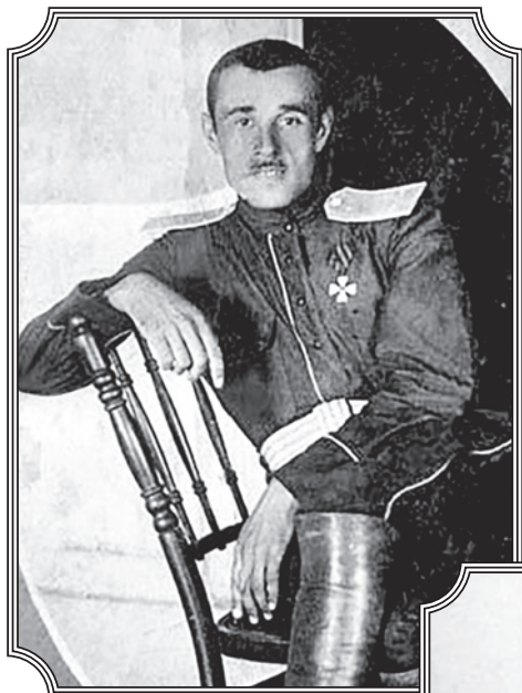
Генерал-майор Н.В. Скоблин в Болгарии. 1922 год