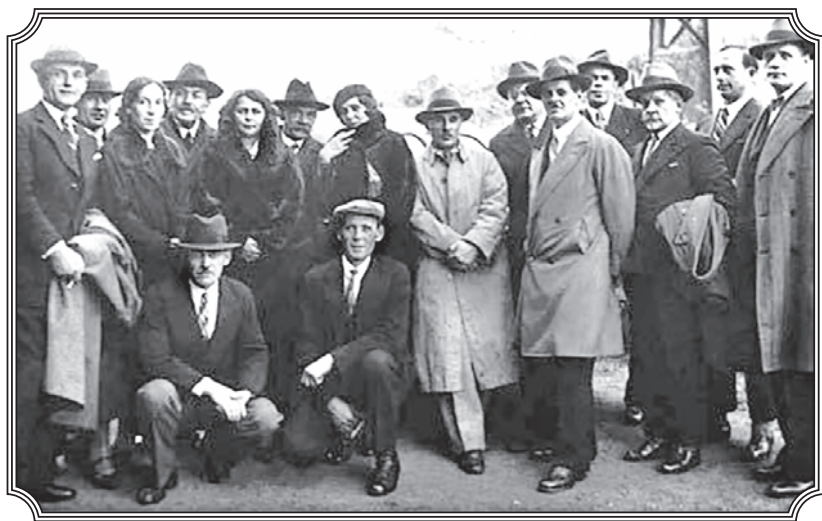
Н.В. Скоблин и Н.В. Плевицкая среди русских эмигрантов в Болгарии