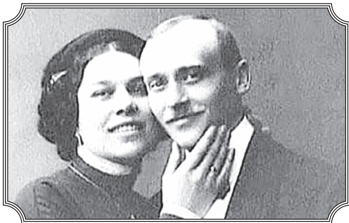
Николай Скоблин и его жена, Н. Плевицкая

Надежда Васильевна Плевицкая изменила его текст (в оригинале было « И холодныя ветры степныя ») и вычеркнула второй куплет: « Ни пути, ни следа по равнинам, // По сугробам безбрежных снегов. // Не добраться к родимым святыням, // Не услышать родных голосов ». В этом варианте (и в её исполнении) романс стал неофициальным гимном русской эмиграции.