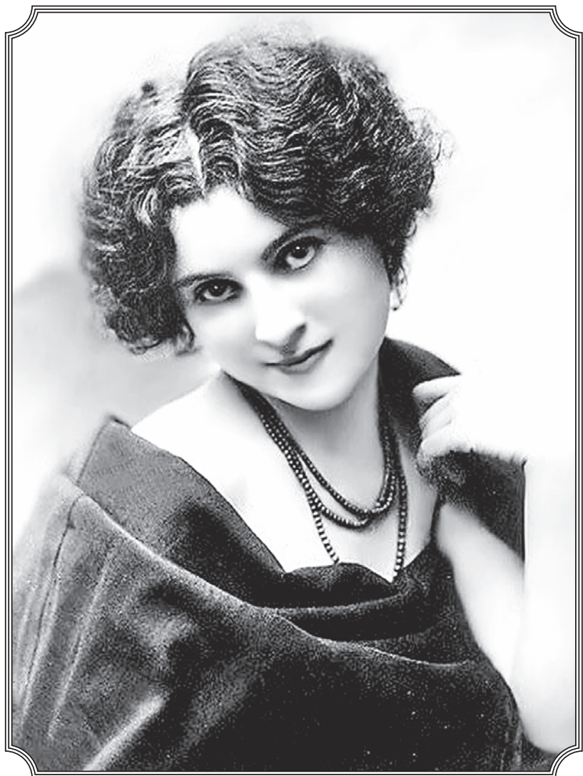
Надежда Васильевна Плевицкая