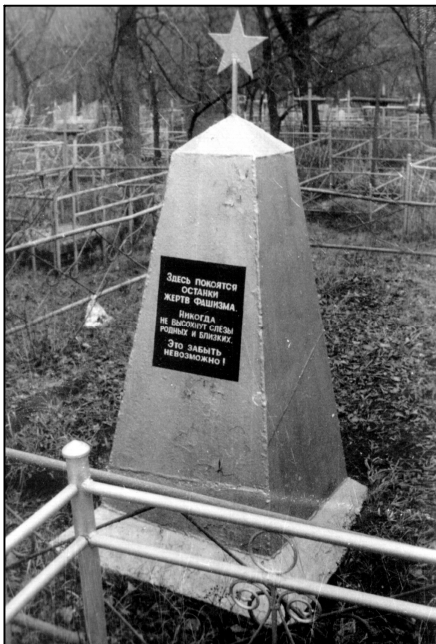
Пам'ятник на могилі жертвам фашистського терору в снт Олександрівці.

Особливо жахлива трагедія сталася 17 листопада 1943 року, коли гітлерівці розстріляли 48 жителів села Кримок.