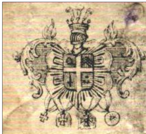
Герб роду Фундукліїв.