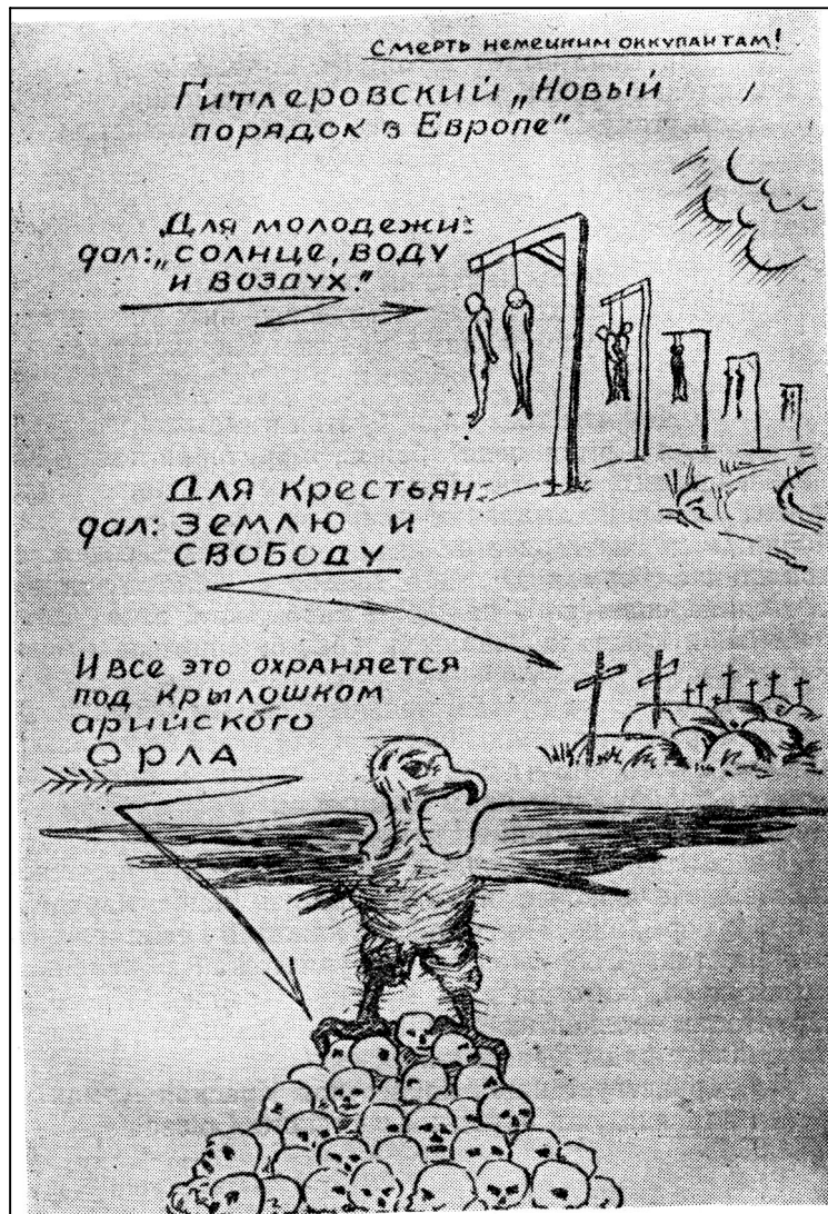
Листівка партизанського з'єднання імені Ворошилова.

За період тимчасової окупації в Олександрівському районі розстріляно 927 чоловік. Лише в одній Олександрівці німці розстріляли 637 чоловік. Розстріли відбулися поблизу Олександрівки. Ними керували німці на чолі з комендантом Ланге і начальником жандармерії Вальтером. Жорстокістю відзначався унтер-офіцер поліцей Литовка.