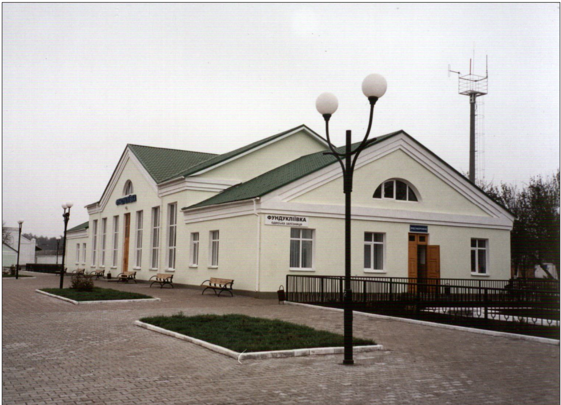
Вокзал залізничної станції Фундуклівка. 2000 рік (вгорі), 2003 рік(внизу).