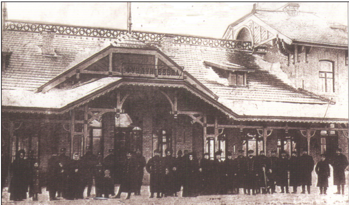
Вокзал станції Фундукліївка. Початок ХХ століття.