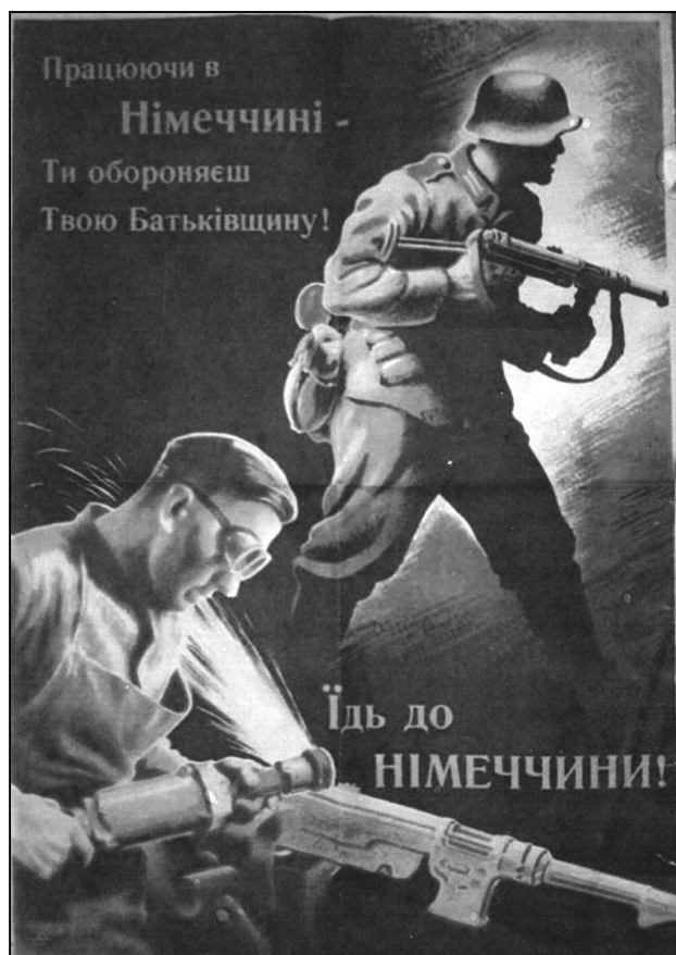
Німецький плакат періоду окупації України.

Особливо кампанія по мобілізації молоді на роботи до рейху посилилась окупантами в 1943 році. Тому чимало молоді ховалось по селах, в лісах, частина вступила до лав партизанських загонів.