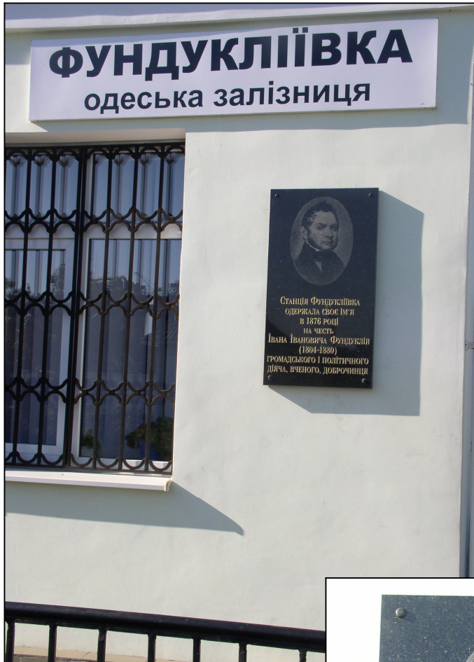
Меморіальна дошка на честь І.І.Фундуклія на залізничній станції Фундукліївка..