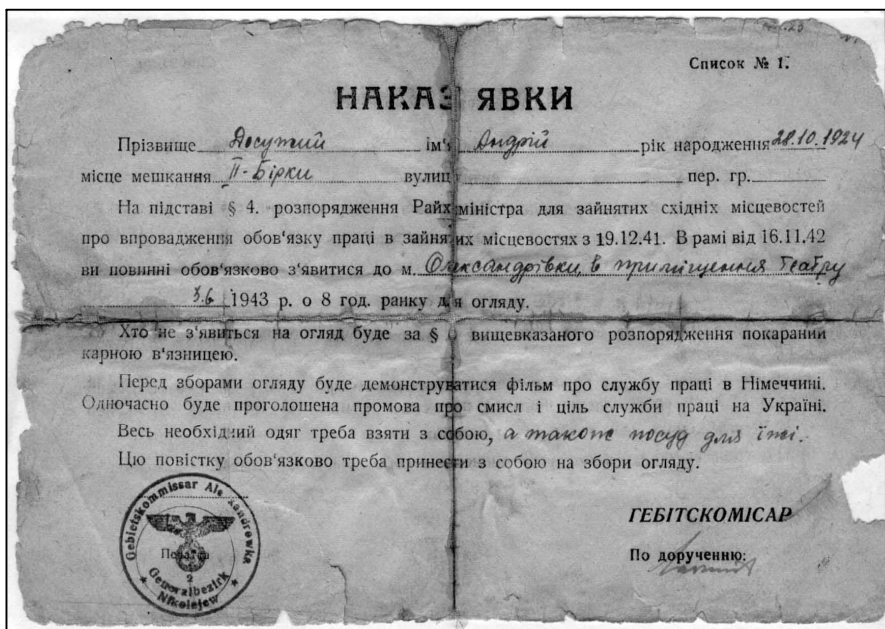
Документ про явку для відправлення до Німеччини. 1943 рік.

Приречені на відправку до Німеччини були з боєм звільнені навесні 1942 року в селі Голиковому кам'янською підпільною комсомольською організацією.