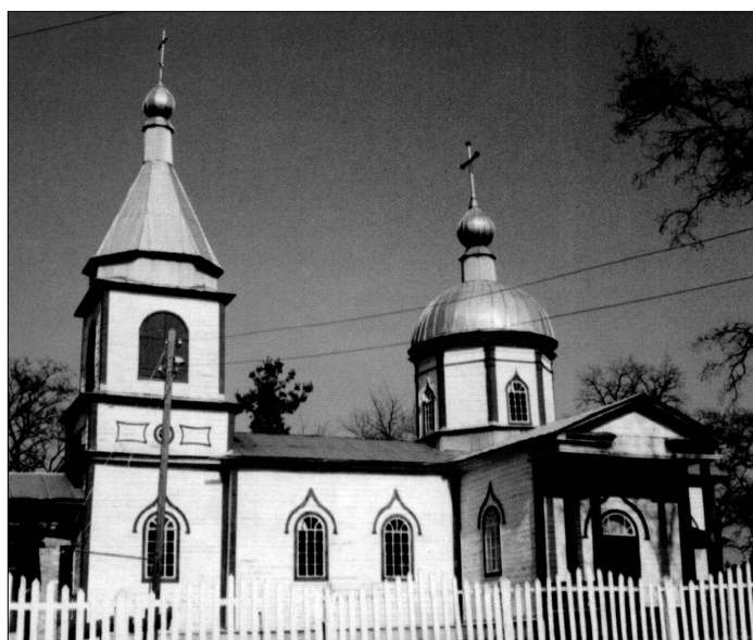
Малюнок 2. 1 - церква Святого Михайла Архистратиґа у Суботіві, 2 – Свято-Миколаївська церква у Бірках.