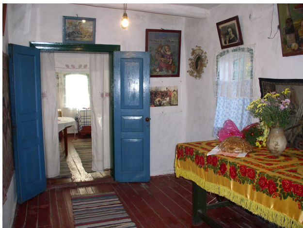
У будинку Токаренків й досі зберігся стіл, за яким працював І. С. Конєв.

села Товсте 70 км. [...] Я наказав І. К. Смирнову розкласти солому і тут же вилетів до нього на двох По-2: на одному я, на другому — мій ад'ютант А. І. Соломахін".