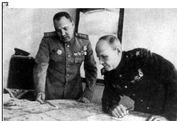
Командуючий 2-м Українським фронтом І. С. Конєв та начальник штабу фронту М. В. Захаров за розробкою бойової операції. Село Бовтишка, 20 лютого 1944 року.