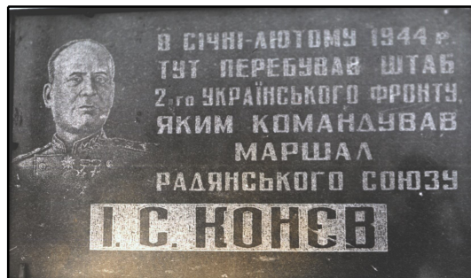
Будинок Токаренка у Бовтищці, де перебував штаб 2-го Українського фронту, та меморіальна дошка на ньому.

З будинком пов'язані імена полководців І. С. Конєва та М. В. Захарова.