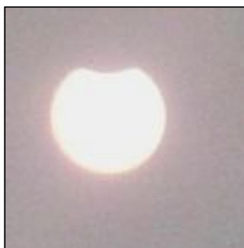
12 год. 30 хв.

Під час часткового затемнення Сонця автором проведене фотографування явища.