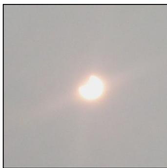
13 год. 20 хв.