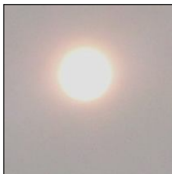
14 год. 05 хв.