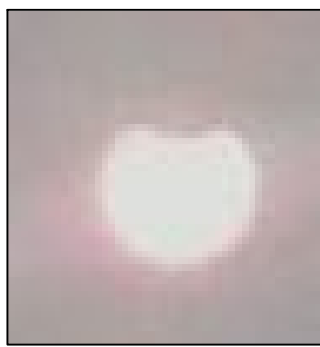
12 год. 40 хв.