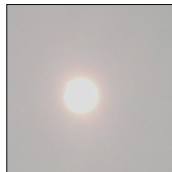
14 год. 07 хв.

Необхідно зазначити, що наступні повні затемнення Сонця будуть в 2033 і 2043 роках, але в Україні їх видно не буде.