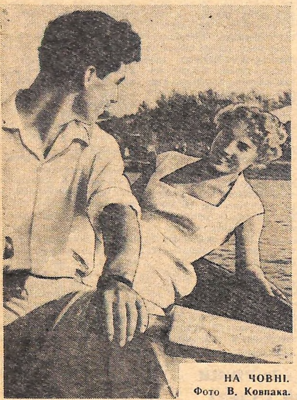
НА ЧОВНІ.