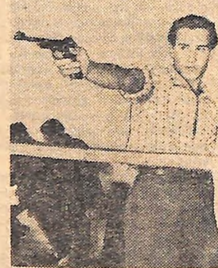
П. Дудник на лінії вогню. Фото В. Штейнберга.

Перемагають сильні: хто регулярно відвідує заняття, уважно прислухається до кожного слова тренера, хто