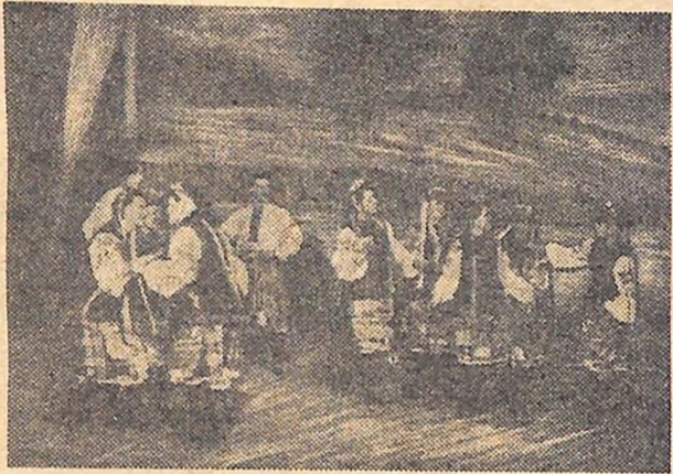
На знімку: сцена з «Ятранських весняних ігор».

родній хореографії, не лише бережно зберігає ці перлини, але й творчо розвиває накопичене, однак, дбаючи про самобутність основи танцю.