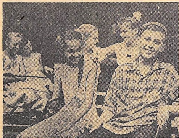
На каруселі.

Село Голиково, Олександрівського району.