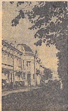
Вулиця Леніна.

Островського аргентинському культурно-освітньому товариству, слова із роману «Як гартувалася сталь» на обкладинці квітка члена Спілки молоді Англії та багато інших фактів — все це підтвердження того, як твердо крокує по земній кулі Павло Корчагін, наскільки близький, зрозумілий його образ мільйонам людей.