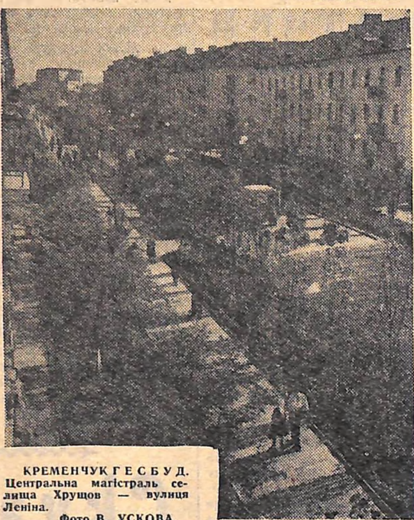
КРЕМЕНЧУК ГЕС БУД. Центральна магістраль селища Хрушов — вулиця Леніна.

ДОРОГИЙ ЧИТАЧУ! РЕДАКЦІЯ газети «Молодий комунар» оголошує конкурс на кращий фотознімок. Надіслані знімки повинні відображати найцікавіше, що найбільш повно і яскраво характеризує трудові діла нашої прекрасної молоді, будні нашої славної семірички. Вони повинні розповідати і про побут, навчання, культурний відпочинок молодих робітників, колгоспників, студентів, учнів. На своїх сторінках газета веде рубрику «З фотоапаратом по області». Отже, можна надсилати фотознімки новобудов області, хороших мальовничих місць, історичних пам'яток та ін. Фотознімки, надіслані на конкурс, необхідно супроводжувати підписом, в якому вказати тему, прізвище, ім'я і по батькові автора, місце роботи та домашню адресу. Розмір — не більший 9x12. За найкращі фотознімки встановлені премії. Конкурс проводиться з 1 серпня по 20 жовтня цього року. Редакція запрошує всіх юнкорів, читачів, фотолюбителів взяти участь у конкурсі. Матеріали надсилайте на адресу: м. Кіровоград, вул. Луначарського, 36. Редакції газети «Молодий комунар». На фотоконкурс.