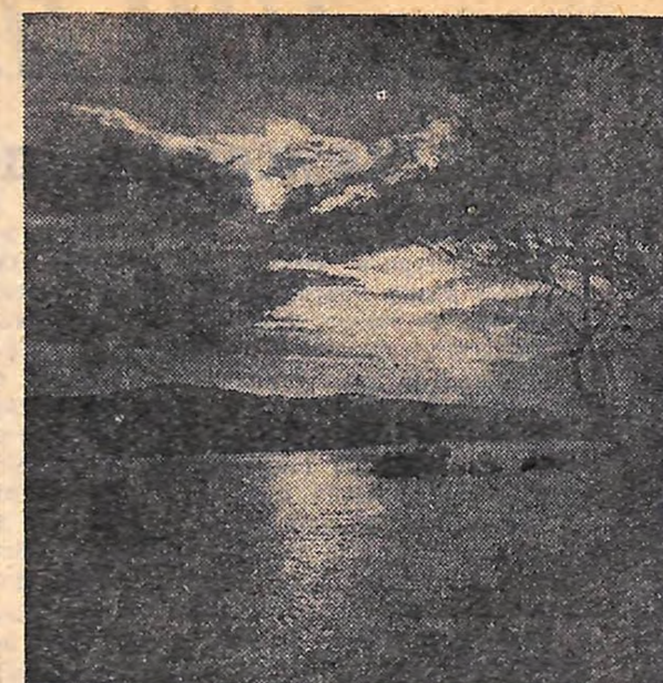
ЗАКАРПАТСЬКА ОБЛАСТЬ. Захід сонця над Тисою.