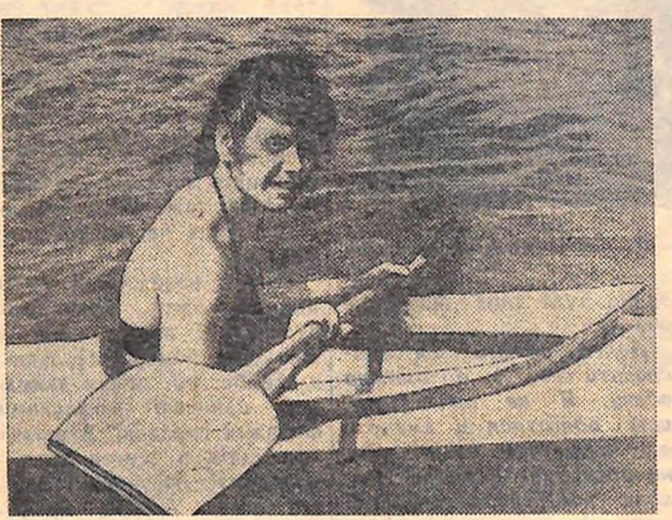
Хороше після роботи сісти у байдарку і помчати назустріч вітру...

Перемогу здобули господарі поля з рахунком 2:1.