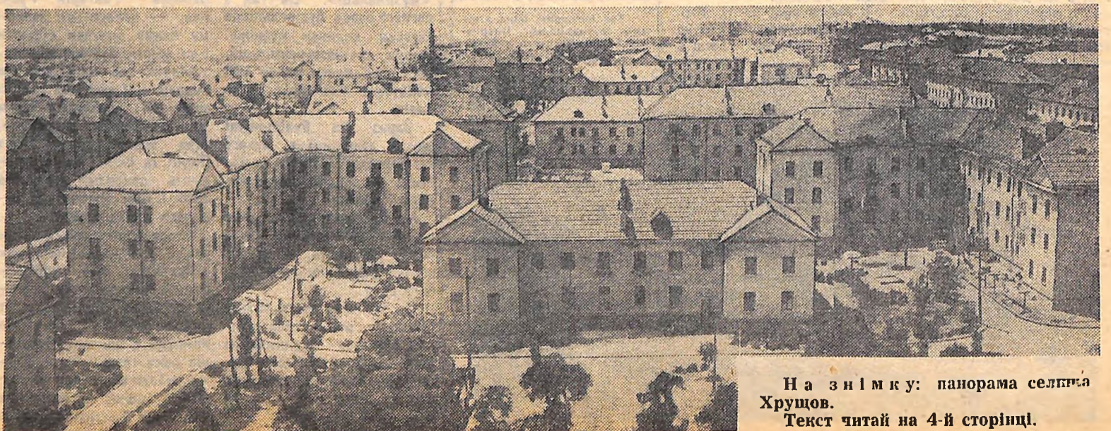
На знімку: панорама селгпса Хрущов. Текст читай на 4-й сторінці.

Будувати швидше, краще, красивіше і дешевше — під таким лозунгом повинна вестися вся робота комсомольських організацій будов і підприємств, що виготовляють будматеріали. Нема сумніву в тому, що комсомол і далі буде гідним помічником партії і уряду в розв'язанні цього загальнонародного завдання.