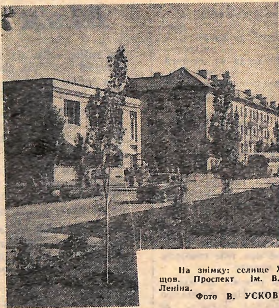
На знімку: селище Хрущів. Проспект ім. В. І. Леніна.