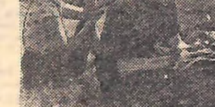
На знімку: туристи з студентського табору на привалі.

ЗАКАРПАТСКА ОБЛАСТЬ. В оздоровно-спортивному таборі Львівського і Ужгородського університетів «Карпати» в цьому році побували 1.200 студентів різних вузів країни. Тут створено всі умови для хорошого відпочинку. Велика увага приділялася спорту. Обладнано волейбольні і баскетбольні майданчики, гімнастичне містечко. Юнаки і дівчата робили туристські походи. Близько 300 чоловік склали норми на значок «Турист СРСР».