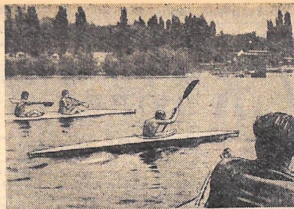
КІРОВОГРАД. Юні спартаківці на тренуванні з греблі на байдарках.

В. ЮР'ЄВ, спеціальний кореспондент «Молодого комунара».