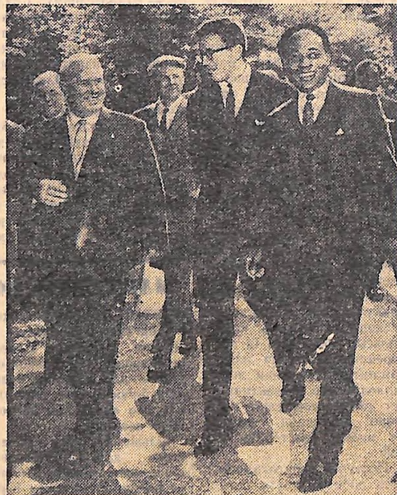
НЬЮ-Йорк. У Гленкові Голова Ради Міністрів СРСР М. С. Хрущов дав обід на честь Президента Республіки Ганні К. Іккрума.

О. GERMAN, учень Маловисківської середньої школи № 3.