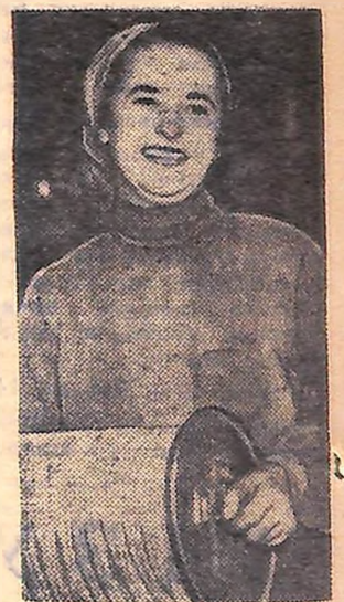
Фото і текст В. Ковпака.

Продукція Кіровоградської в'їрвовочно-шпагатної фабрики користується великим попитом і за межами України. В Азербайджан, Казахстан, далекий Сибір відправляються великі партії котків в'їрвовок. Працює на підприємстві переважно молодь.