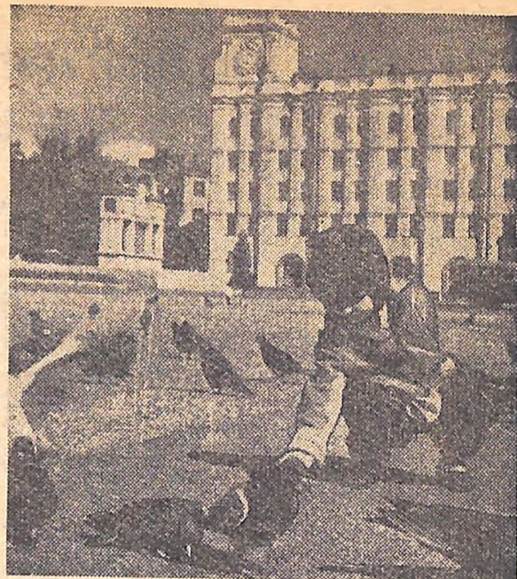
Світланні голуби.

те, як повинна поводити себе господарка під час прийому гостей.