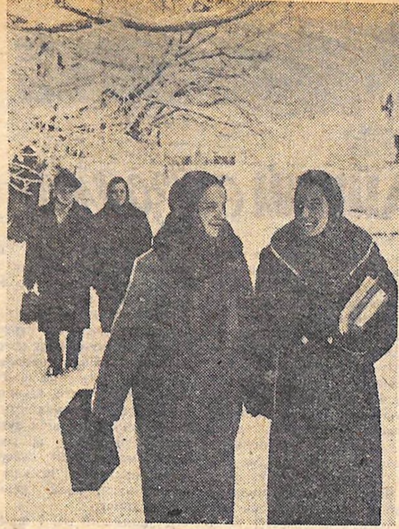
Для тебе, комсомольський активісте!

МАЛЕНЬКІ книжечки з значком члена ВЛКСМ і надписом «Комсомольському активісту» можна зустріти в будь-якому книжковому магазині. Їх випускає видавництво ЦК ВЛКСМ «Молода гвардія».