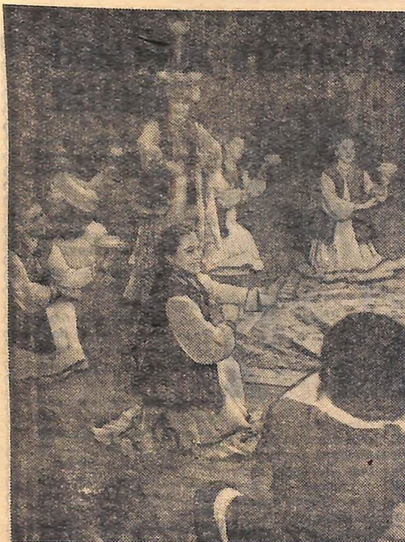
Концертний зал переповнений. На просторій сцені обласної філармонії дає концерт лауреат Всесвітніх конкурсів — Башкирський ансамбль народного танцю. Виступають наші друзі, з якими змагається Кіровоградщина.

Башкирський ансамбль народного танцю на базі самодіяльного танцювального колективу був заснований ще в 1939 році. Його незмінний художній керівник, нині заслужений діяч мистецтва РРФСР та БАРСР Файзі Гаскаров, з перших днів поставив перед колективом ансамблю надзвичайно складне, але почесне завдання: глибоке вивчення і повне розкриття художніх якостей не тільки башкирських народних танців, а й багатьох інших народів.