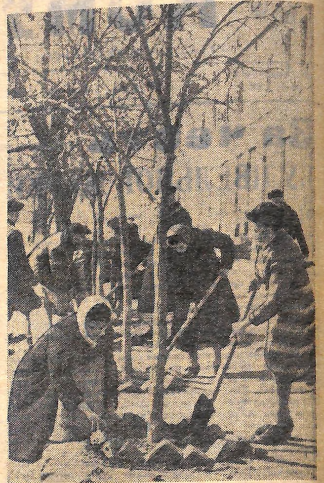
На знімку: учні Бобриньської торговельно-кооперативної школи обкопують дерева біля районувермага.

В. МОСТОВА, старша піонервожата Богданівської середньої школи Знам'янського району.