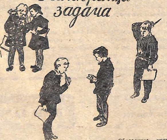
Обкладинка книги М. Стояна.

Зустрівшись із читачами обласної дитячої бібліотеки імені А. Гайдара, письменник Ю. Мокрієв подарував юним землякам повість «Острів Забутий», яка тільки-но вийшла з друку. Багато цікавих пригод сталося з героями книги — піонерами під час літніх канікул. У дніпровських плавнях вони знаходять зруйнований мисливський будинок і створюють у ньому клуб кінатів. Опустившись у таємничу печеру на Куцугурах, діти несподівано натикаються на багатющу родовищу марганцевої руди. Нижче ми друкуємо уривок з цієї повісті.