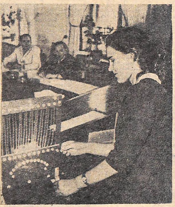
В Кіровоградському педінституті імені О. С. Пушкіна триває літня скаменнація сесія.