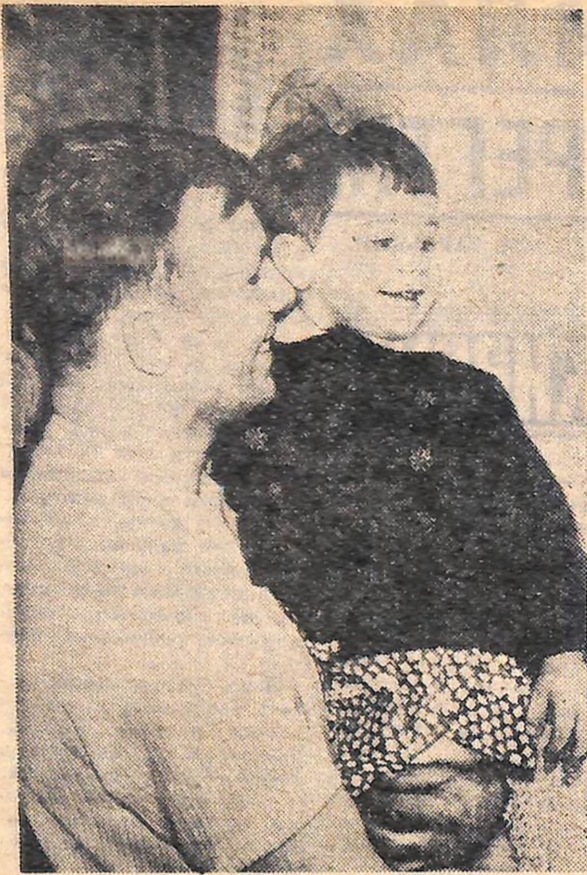
Юрій Олексійович Гагарін з дочкою Оленкою