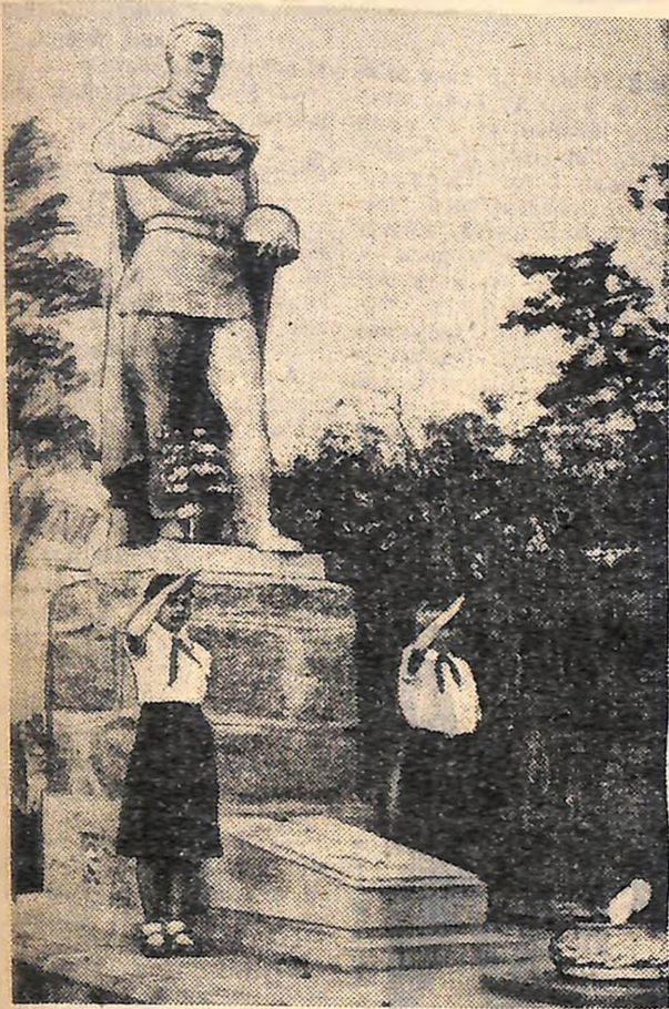
Пам'ятник невідомому солдату в м. Кіровограді.