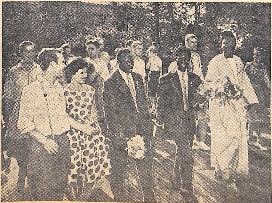
ВСЕСВІТНІЙ ФОРУМ МОЛОДІ В МОСКВІ. Група учасників Всесвітнього форуму молоді відвідала перший Державний підшипниковий завод.