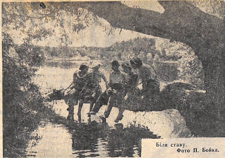
Біля ставу.