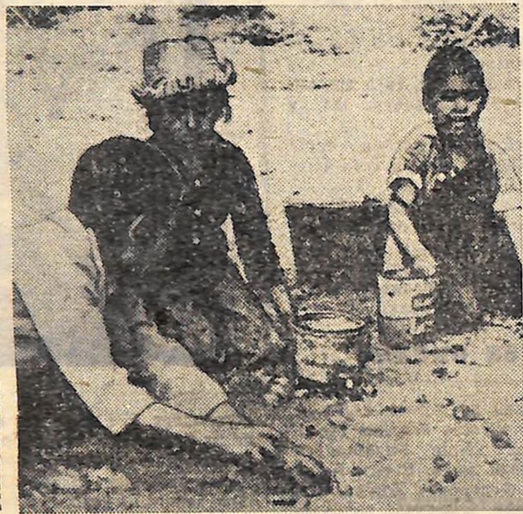
НА ЗНИМКУ: діти кочових робітників.

Всі ці махінації відомі властям. Однак ні власті, ні профспілки — ніхто нічого не вживає для того, щоб полегшити становище кочових сільськогосподарських робітників. Така сумна доля тих, хто трудиться на полях Сполучених Штатів.