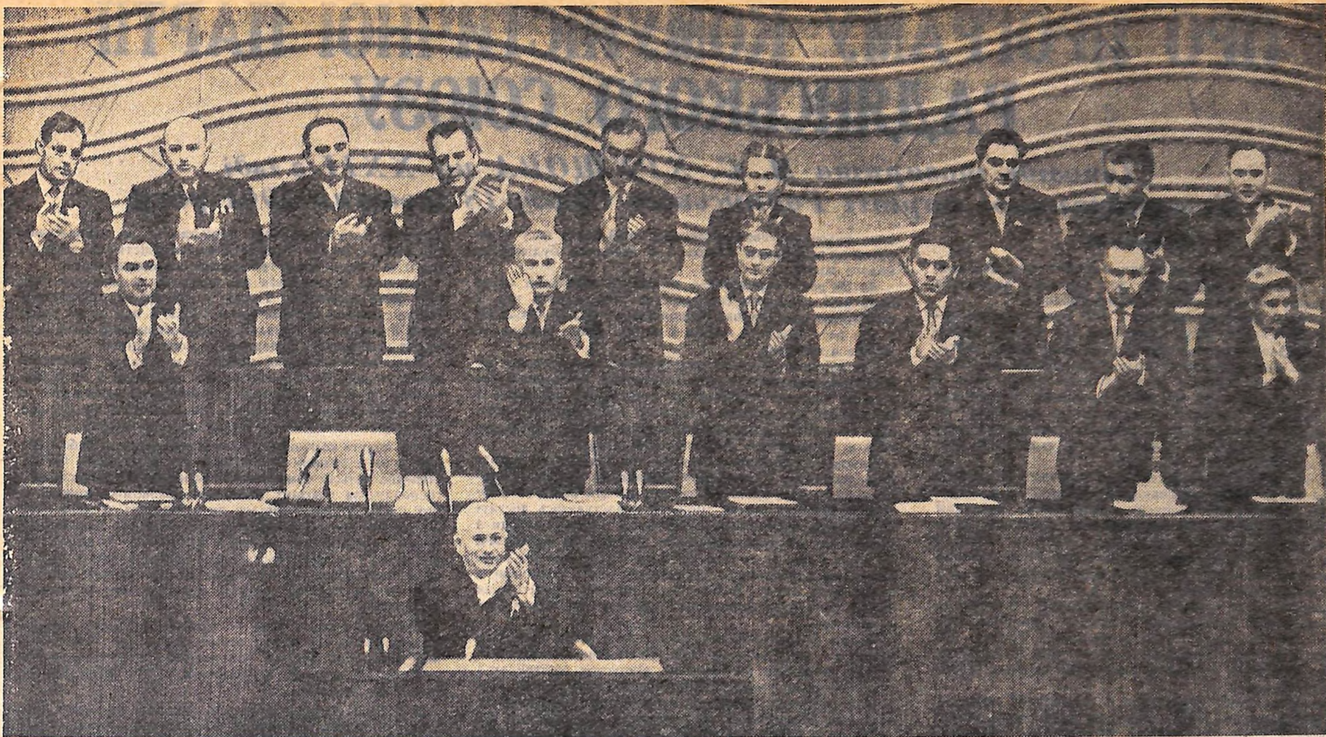
МОСКВА, 17 жовтня. XXII З'ЇЗД КОМУНІСТИЧНОЇ ПАРТІЇ РАДЯНСЬКОГО СОЮЗУ.

На знімку: в президії з'їзду. На трибуні М. С. ХРУЩОВ.