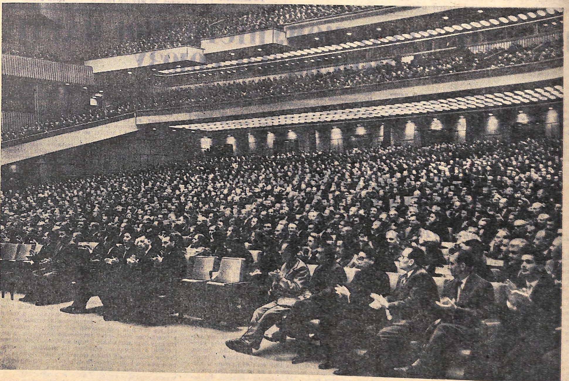
МОСКВА, 17 жовтня. XXII З'їзд КОМУНІСТИЧНОЇ ПАРТІЇ РАДЯНСЬКОГО СОЮЗУ. На знімку: в залі Кремльського Палацу з'їзду.