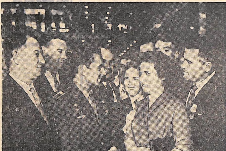
МОСКВА. 17 жовтня. ХХІІ з'їзд Комуністичної партії Радянського Союзу.

Обговорено і прийнято на районному зльоті молодих кукурудзоводів.