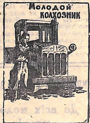
ЖУРНАЛ ЦК ВЛКСМ

ЖУРНАЛ пропагує кращий досвід комсомольської роботи, розповідає про ініціативу комсомольців і молоді в розвитку промисловості, сільського господарства, культури і мистецтва нашої країни. Інформує про всі знаменні події в житті комсомолу, про рішення ЦК ВЛКСМ, обкомів, райкомів, ЦК ЛКСМ союзних республік.