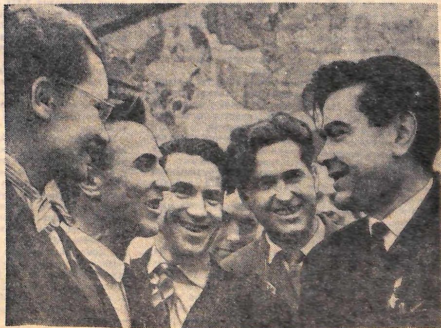
МОСКВА. XXII з'їзд Комуністичної партії Радянського Союзу. На знімку: Герой Радянського Союзу О. П. МАРЕСЬЄВ (справа) серед делегатів з'їзду.

Наприкінці вечірнього засідання з'їзд вітали тепло зустрінуті делегатами і гостями юні піонери.