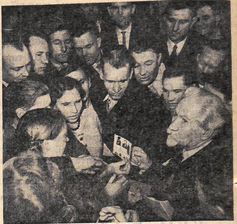
МОСКВА. XXII з'їзд Комуністичної партії Радянського Союзу.

І ось у такий найвидатніший поворотний момент історії знайшлись жалюгідні відщепенці, що фальшиво іменують себе марксистами, які намагаються виступати проти нашої Програми з антиленінськими, негідними