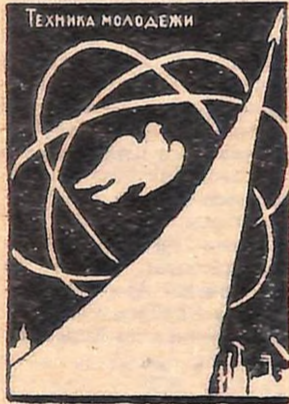
ЩОМІСЯЧНИЙ ілюстрований популярний виробничо-технічний і науковий журнал. Прогнози завдання семирічного плану, в популярній формі розповідає про великі будови країни.

кращим розповсюджувачем молодіжних видань?