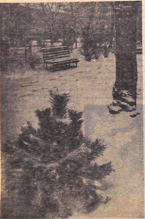
ЗИМА ПРИЙШЛА. Фотохуд В. Ковпака.

М. О. Харламов відповів на запитання журналістів. Потім кореспонденти ознайомилися з документами, що характеризують злочини Хойзінгера.