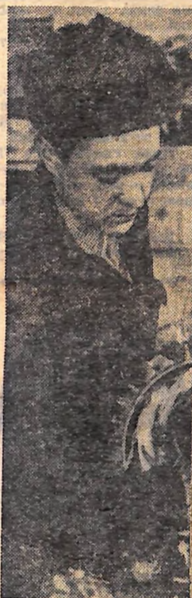
Електроцех — одна з кращих дільниць Кіровоградського районного відділення «Сільгосптехніки». З початку нинішнього року тут відремонтовано 269 електромоторів, 16 генераторів, виготовлено 9 силових трансформаторів, 125 акумуляторів і 8 зварювальних генераторів.