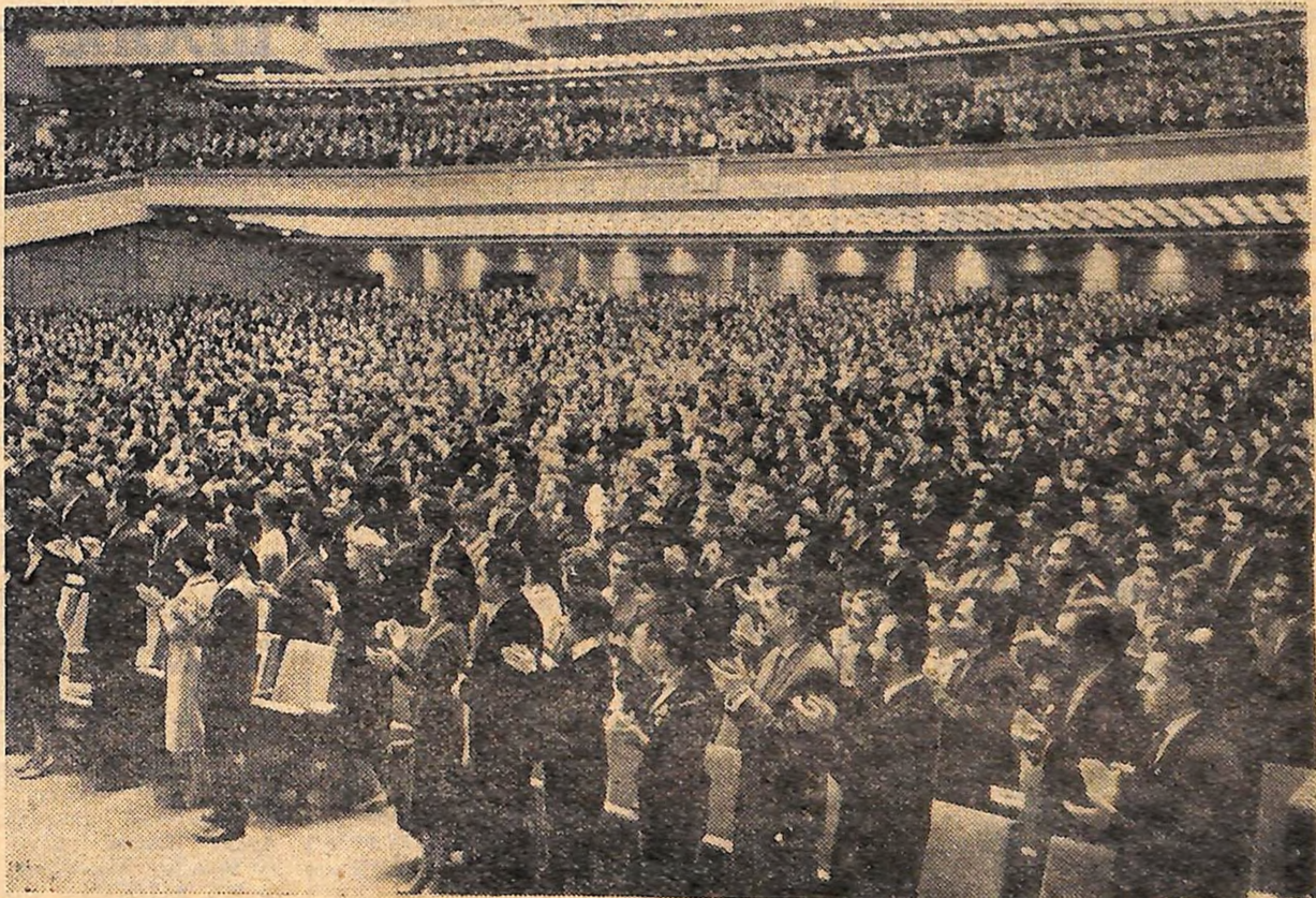
МОСКВА. XIV з'їзд ВЛКСМ.