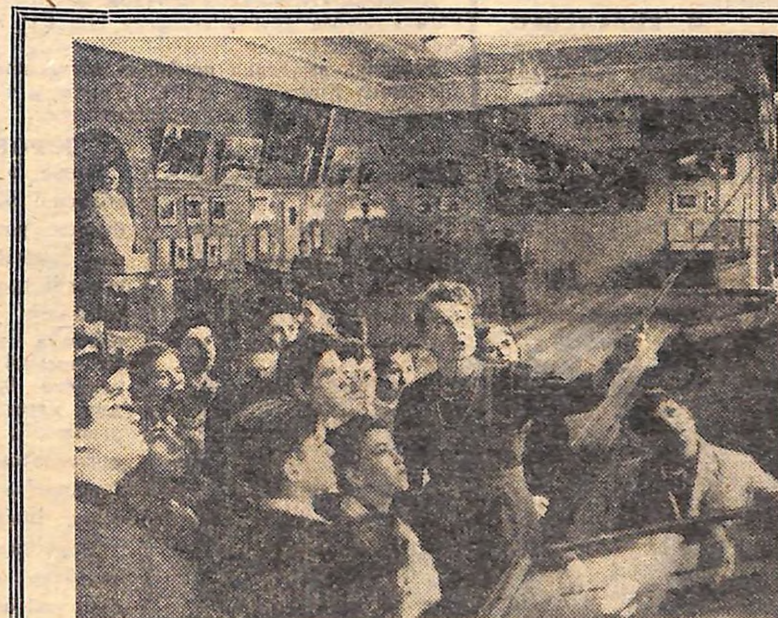
У Київському філіалі Центрального музею В. І. Леніна відкрився новий розділ — «Торжество ідей комунізму». Більш як 600 експонатів, розміщених у двох залах музею, розповідають про великий подвиг радянського народу, який здійснив під керівництвом Комуністичної партії ленінські заповіді про побудову першого в світі соціалістичного суспільства і тепер переможно іде по шляху будівництва комунізму.

На фото: екскурсанти оглядають новий розділ музею.