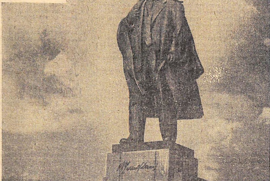
Пам'ятник В. І. Леніну в м. Ульяновську.

ДЕНЬ 22 квітня минулого року перетворився у незабутнє свято для вихованців. На відкриття музею прийшли