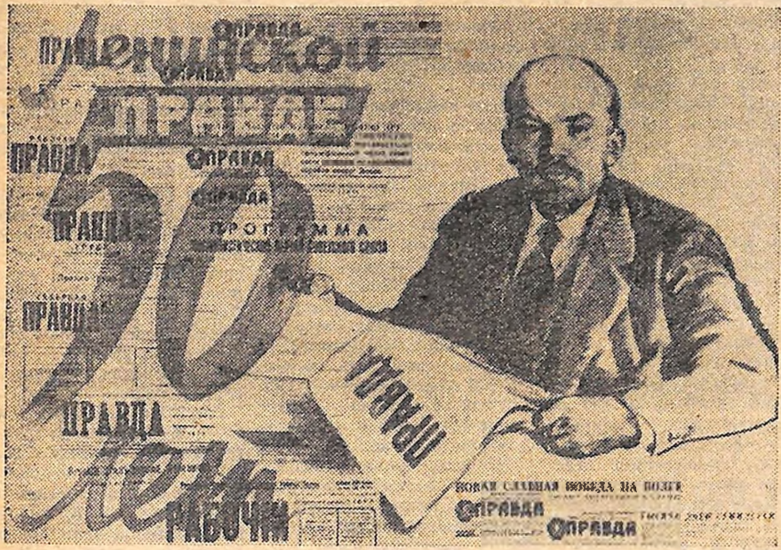
Плакат художника І. Гринштейна.