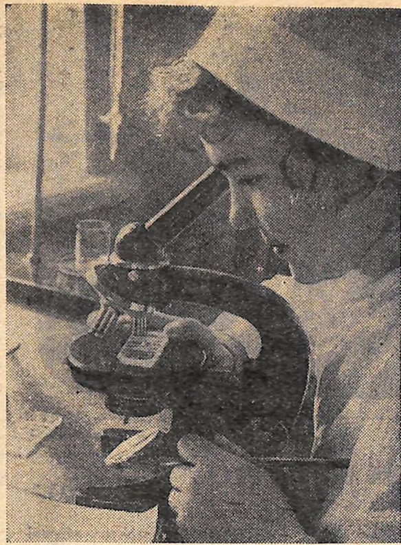
Трудачі міста Хруцов недавно одержали хороший подарунок — здано в експлуатацію нове лікарняне містечко.