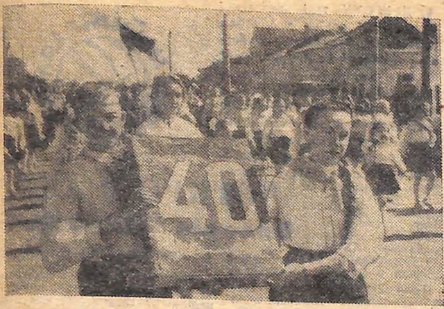
Святкування 40-річчя піонерської організації імені В. І. Леніна в м. Олександрії. На знімках: (зліва) в колоті юних демонстрантів; (справа) учасники художньої самодіяльності школи-інтернату на стадіоні виконують український танець.