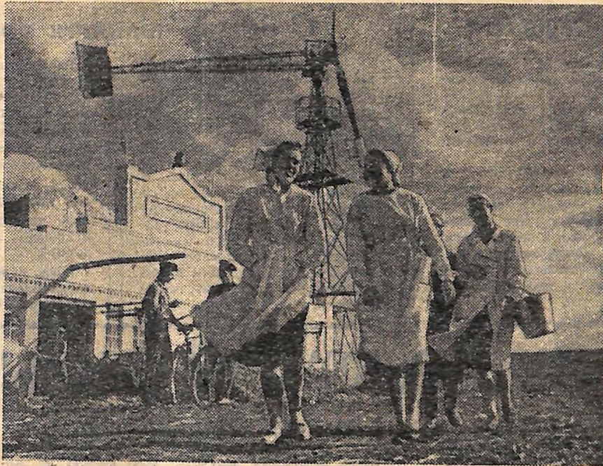
«НА ФЕРМІ». (Третя Всесоюзна художня фотовиставка «Семирічка в дії» 1962 року).

Колгосп імені Леніна Петрівського району.