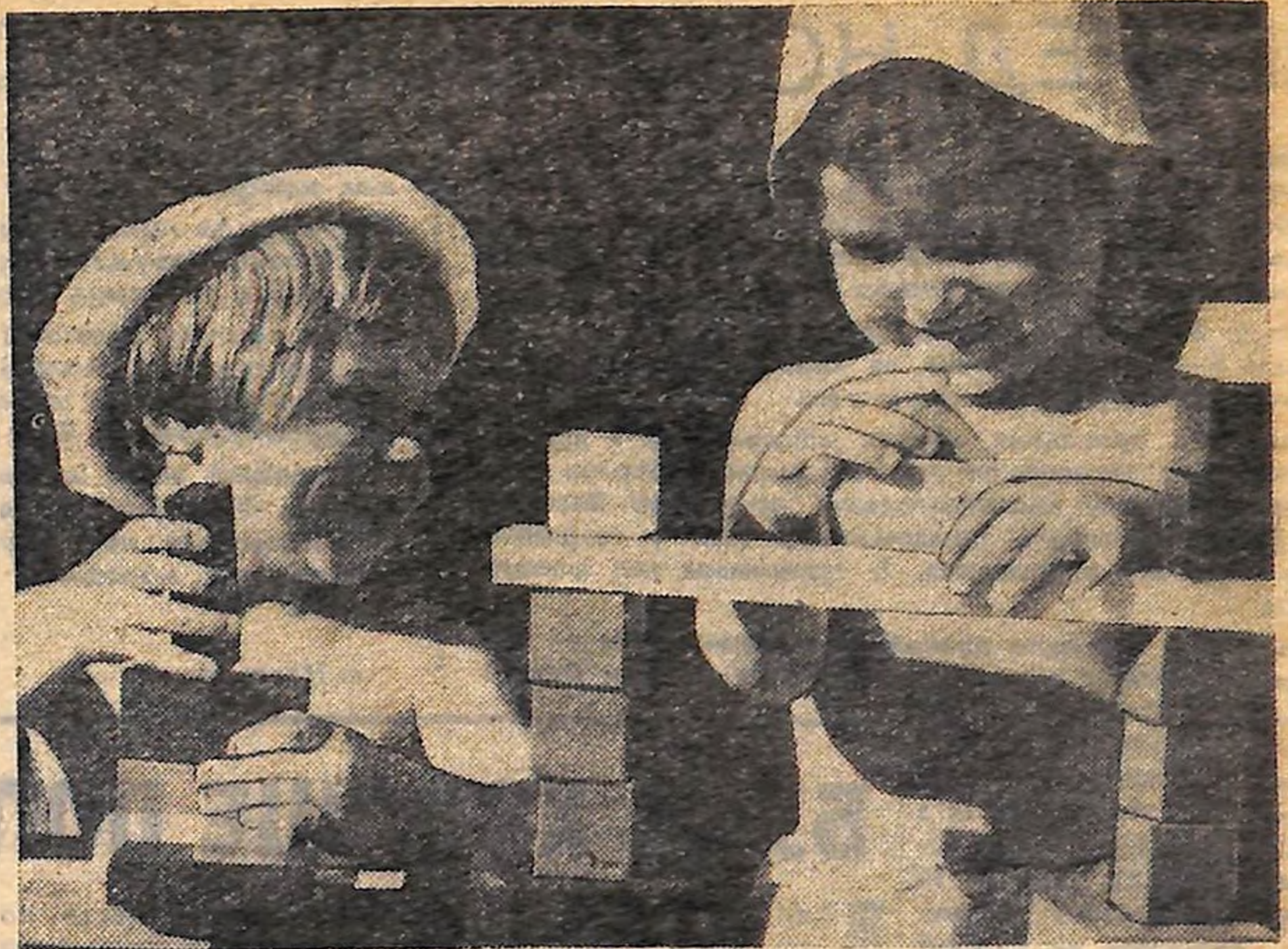
Дитячий садок № 22, що розташований на території сільськогосподарської виставки.