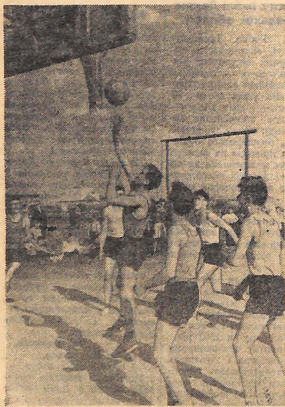
Традиційними стали спортивні зустрічі між колективом фізкультури Завалівського графітного комбінату Гайворонського району і спортсменами Ульяновського цукрового заводу. Весною цього року в Заваллі проведено товаришескі зустрічі з футболу та баскетболу. А скільки ще цікавих поєдинків готує робітникам нове спортивне літо!

У КНИЖЦІ англійського пілота-випробувача Г. П. Пауелла «Випробувальний політ» розповідається про такий рідкісний, майже фантастичний випадок. Англійський пілот Стелленд виконував штопор на літаку з відкритою кабіною. Не зумівши вийти з штопору, пілот відстебив прив'язане ремінь і вистригнув із кабіни. Літак, який був у штопорі, після чергового витка опинився під пілотом і буквально «піймав» його в кабіну на повному ходу. Потім літак почав самостійно виходити із штопора. Заявивши своє місце, пілот знову продовжував вести машину.