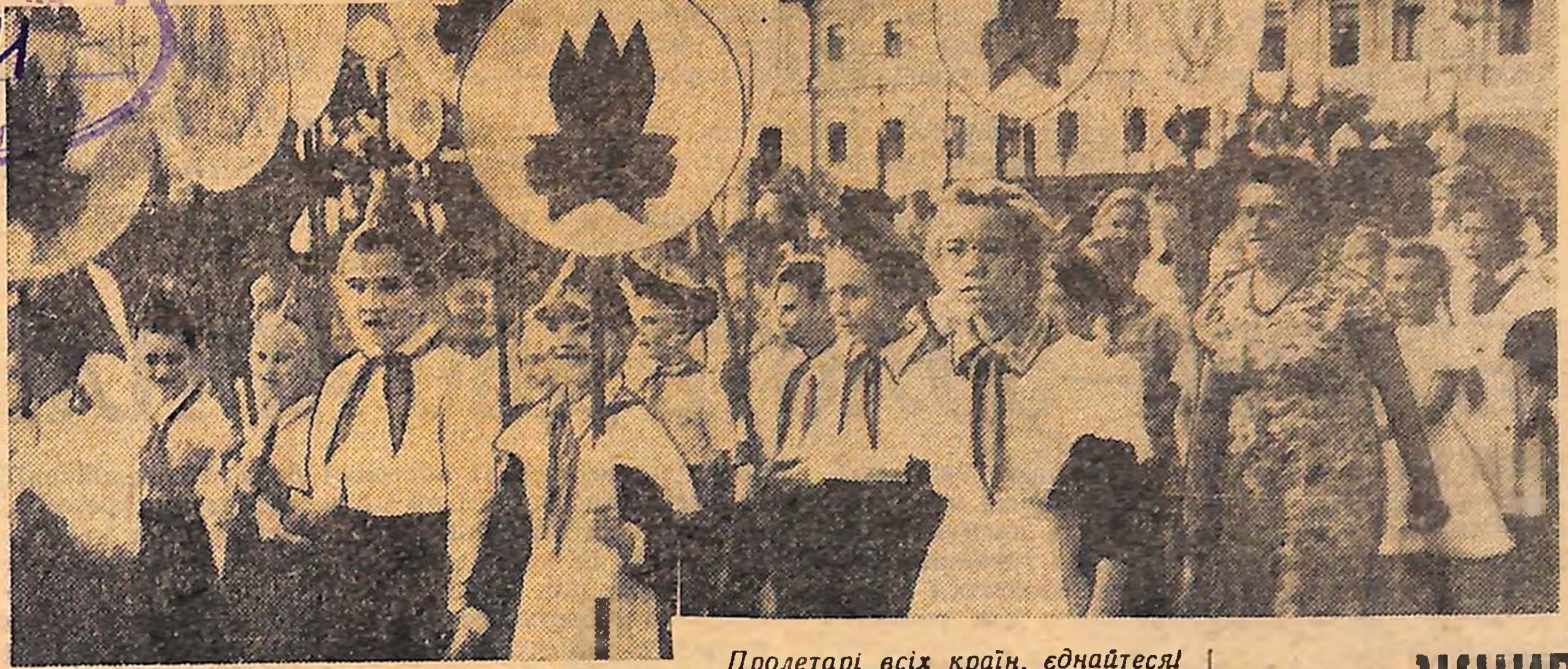
Пролетарі всіх країн, єднайтеся!