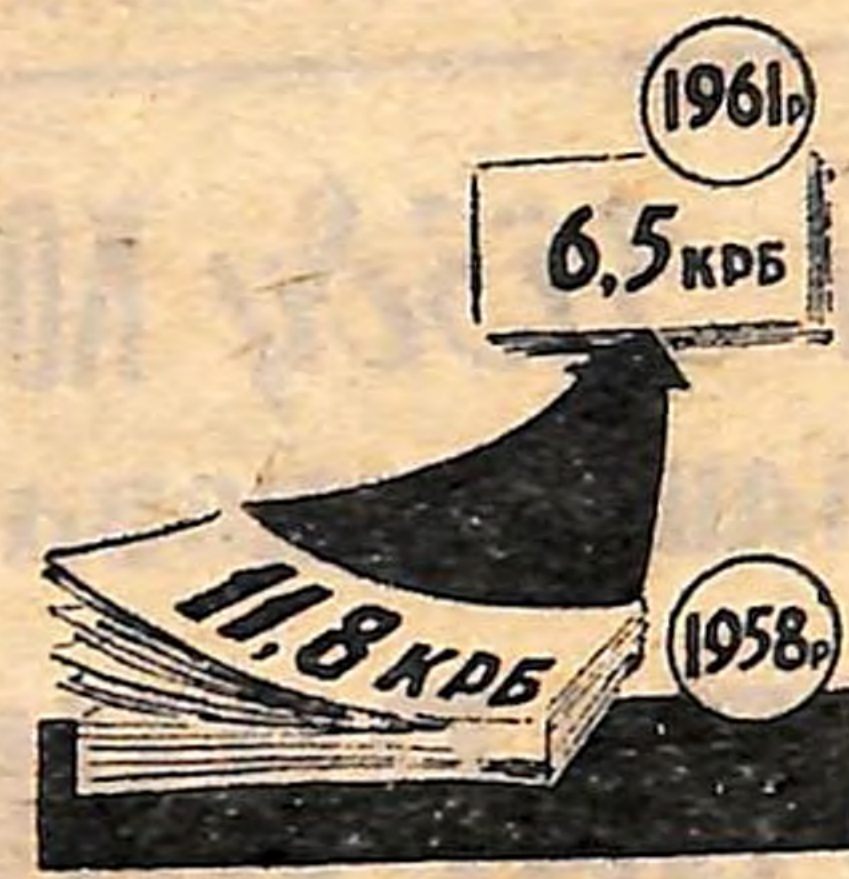
А так знизилась собівартість одного центнера молока.

містких процесів на фермах не буде, якщо корови поїдатимуть дорогі корми. Механізатори колгоспу ведуть боротьбу за дешеві поживні корми. В нинішньому році в колгоспі 3.282 гектари або 40 процентів сільгоспугідь зайнято під кукурудзою, 440 гектарів — під цукровими буряками, 106 — під горохом і бобами. Горох збагатить раціони на перетравний білок, і не будуть перевитрати соковиті і концентровані корми.