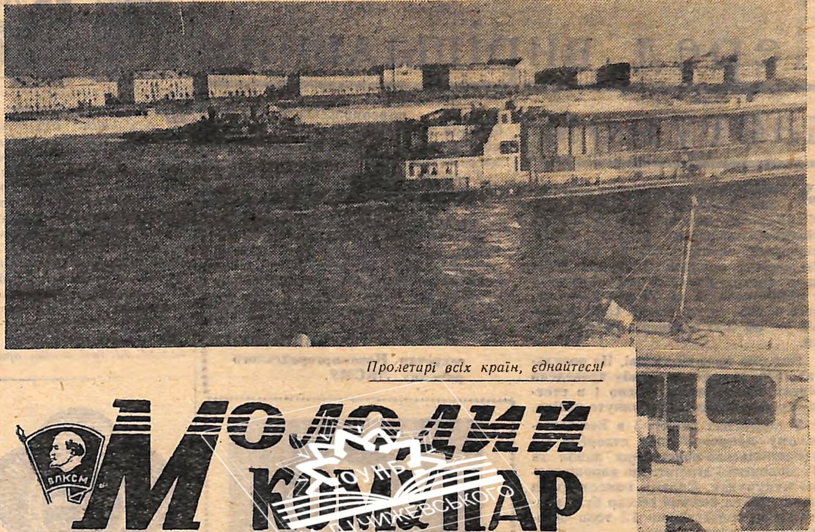
Пролетарі всіх країн, єдніться!