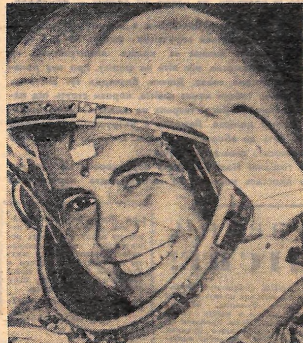
На знімках: (вгорі) льотчик-космонавт майор А. Г. НІКОЛАЄВ після чергового тривалого тренування в макеті корабля; (внизу) льотчик-космонавт П. Р. ПОПОВИЧ.