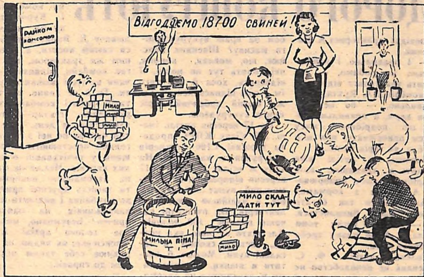
Виробництво свинини по-новопразьки.