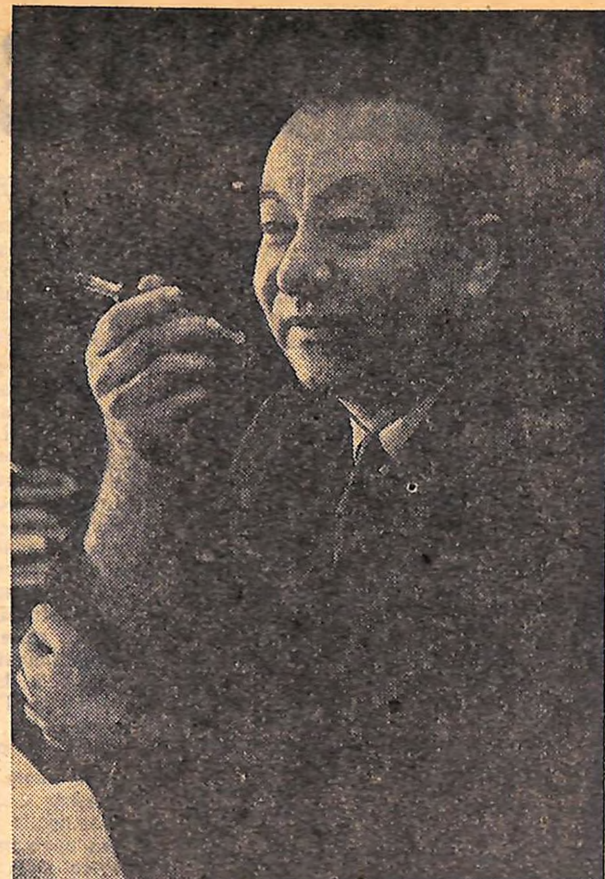
Український поет Андрій Самійлович МАЛИШКО (до 50-річчя з дня народження).

Інокли найде така хвилина, Ніби я винен у всьому світі, — За хліба шмат, що не має людина, За недорід на зеленій віті; За вікову материнську муку, І за посуху на ниві й луці, Хлопець любив, а прийшла розлука, Я ніби винен у тій розлуці; За сухоїї, за град із грому, І за ракетно-космічні невдачі, Муж не вернувся давно додому,