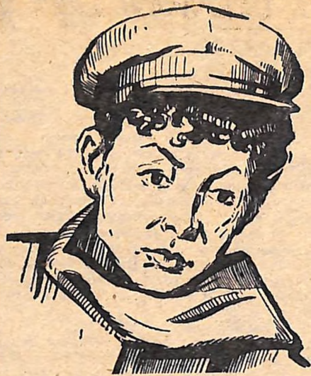
Васько — артистка О. Дзизюк.

Та не ці дріб'язковості вирішують долю загалом хорошої, сучасної вистави. Її герої немов би звертаються до гля-