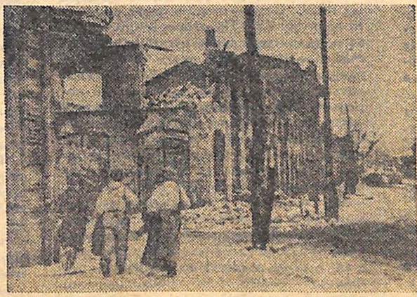
КІРОВОГРАД, ВУЛ. КАРЛА МАРКСА. 1944 Р.

Зроби своє місто ще кращим. Хай засміються нові квартали й вулиці... То буде найкраща пам'ять твоя про біліц 2-го Українського, що, посмилючи претирство смерті, гнали фашистів з рідної землі.