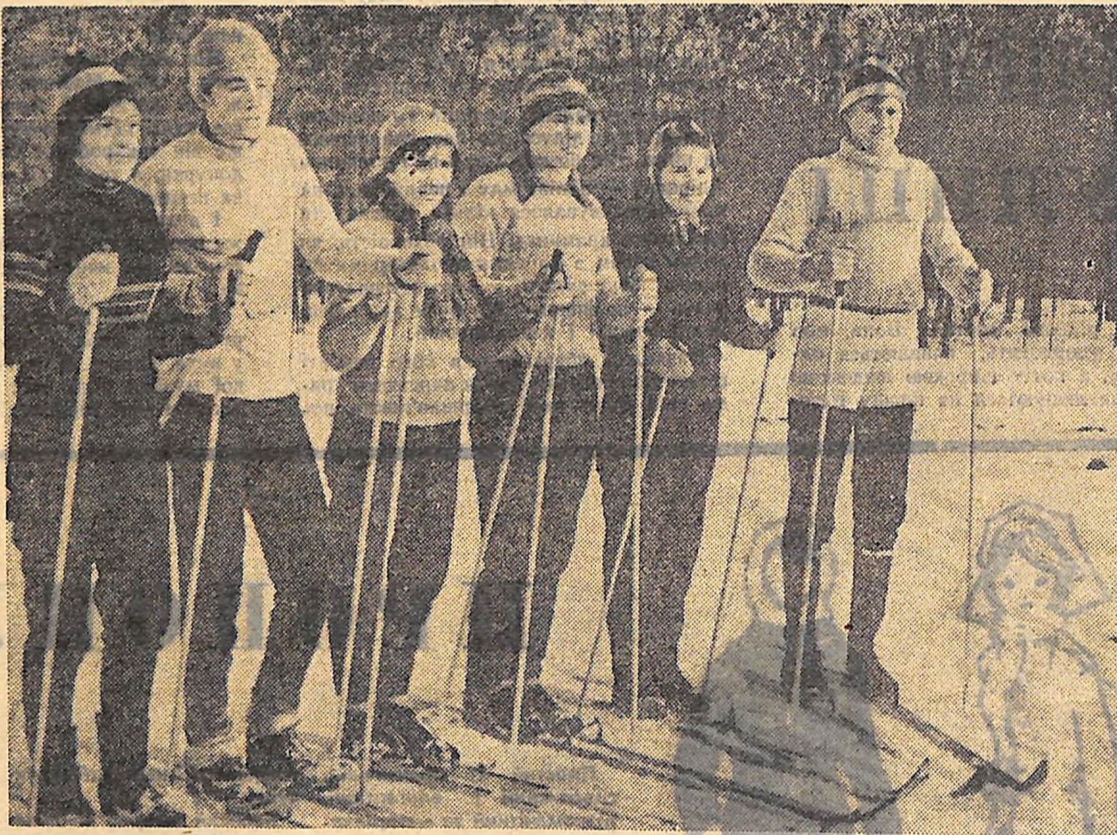
Щобно на фініші судді змагання прайоріадам. Лижники Новомиргородського району задоволені першим місцем за командою.