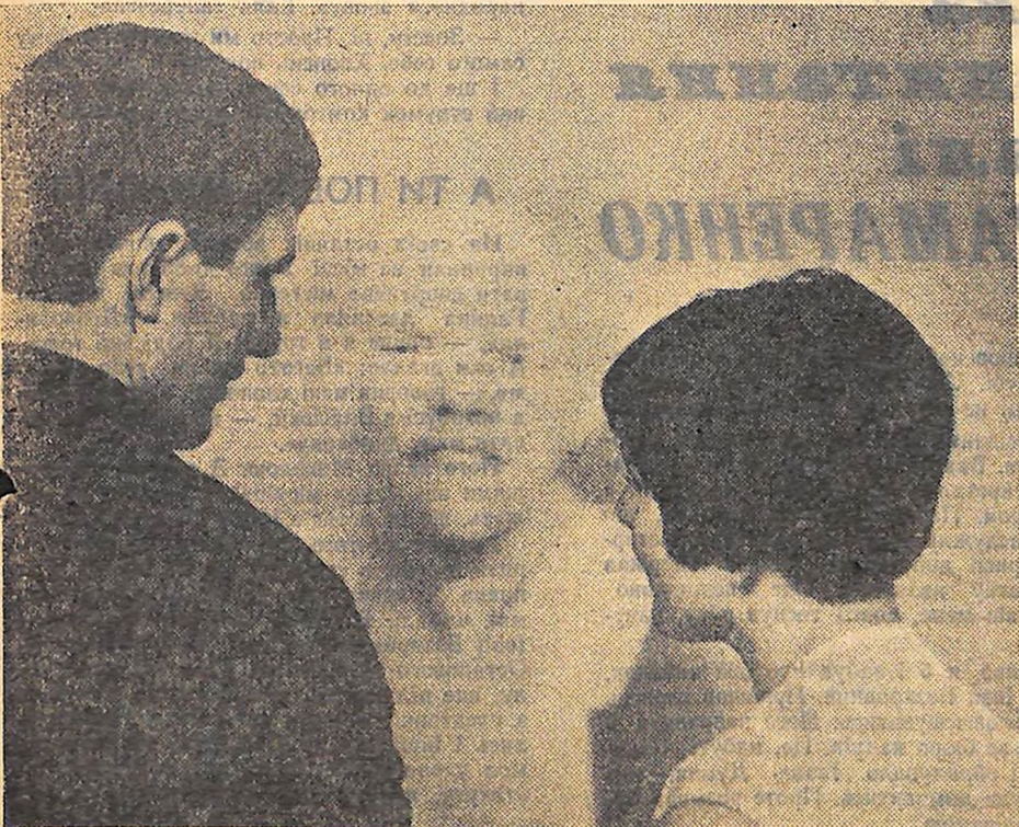
Вони прийшли до Леніна.